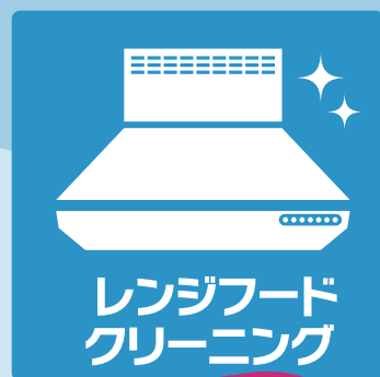
レンジフード クリーニング