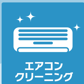
エアコン クリーニング