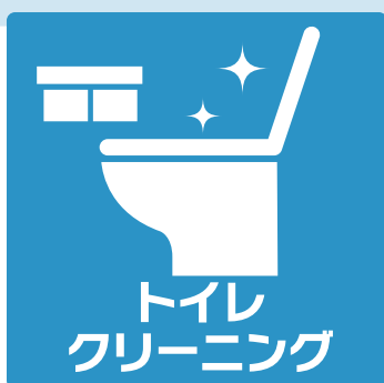
トイレ クリーニング

サービスの内容、金額等についてはダスキンのホームページをご覧ください。 https://www.duskin.co.jp