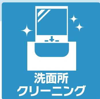
洗面所 クリーニング