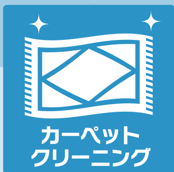
カーペット クリーニング