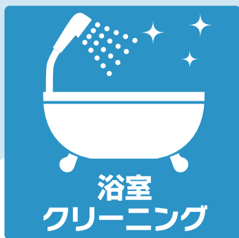
浴室 クリーニング